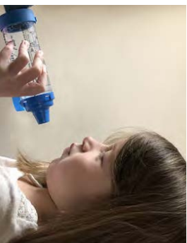
8. עצור את השינה במשך 10 שניות אם אתה יכול. לאחר מכן נשוף אוויר החוצה לאט.