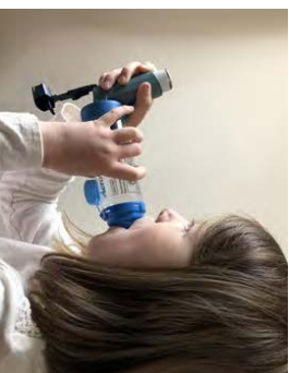
7. שאף פנמהלאיט ועמוק