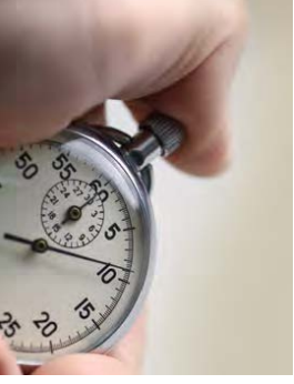
8. אם דרושה לך לחוצה נוספת של חרופה, המתן דקה אחת ואז חזור על שלבים 9-5.