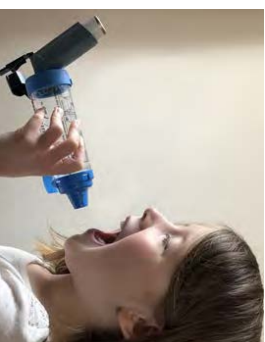
4. נשוף אוויר החוזרעוד הסוף