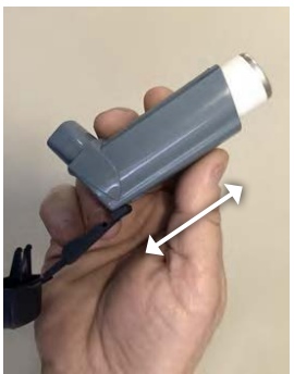
2. נער את המשאף במשך 5 שניות