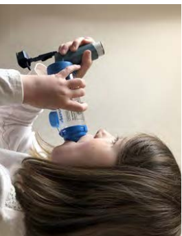
5. סגור את השפתיים סביב הפייה