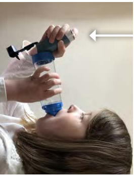
6. לחץ כליפי מטה כאן