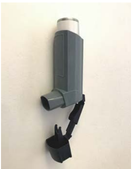
1. הסר את המכסה מהמשאף